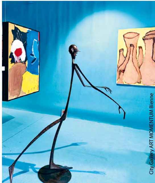
City Gallery ART MOMENTUM Biennale

Les œuvres sculptées captivent notre attention à travers leur tridimensionnalité ainsi qu'à travers l'usage de matériaux divers comme la pierre, le métal ou le bois.