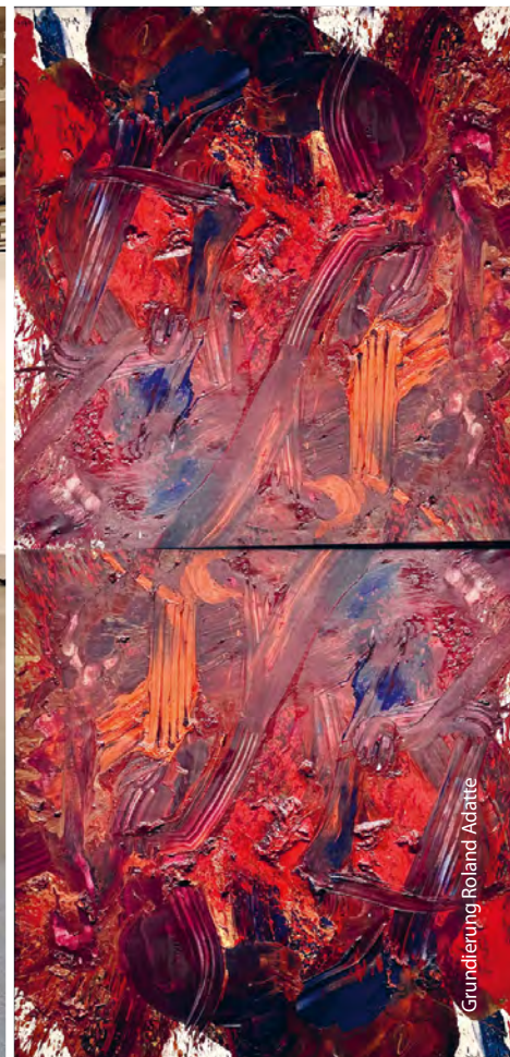
Grundierung Roland Adatte

Pour toute question concernant l'exposition et les conditions-cadres, merci de contacter Ute Winselmann Adatte par courriel à l'adresse ute_von_asuel@gmx.ch ou par téléphone au n° 032 322 95 55.