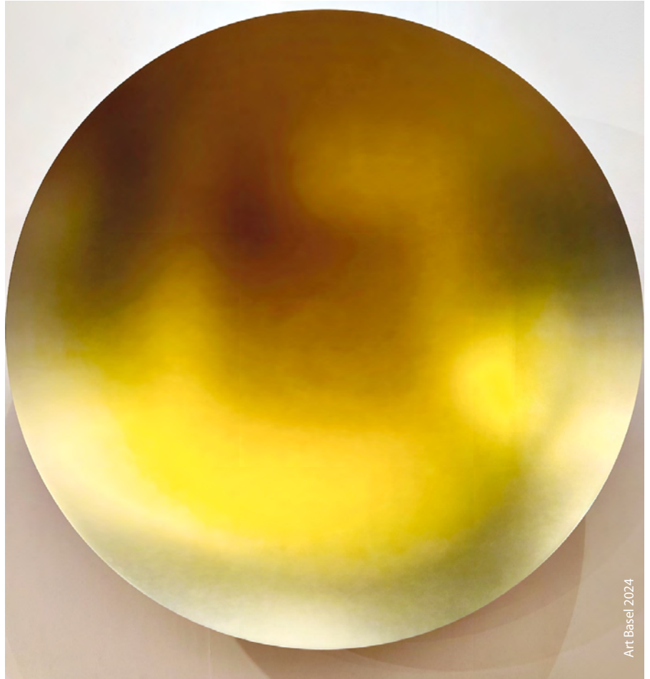
Art Basel 2024

Les œuvres peintes pourraient englober une multitude de styles et de techniques qui représentent le thème de différentes manières. Exemples: des portraits de personnalités charismatiques ou des représentations abstraites avec des couleurs et formes charismatiques ainsi que des représentations réalistes de notre environnement.