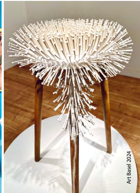
Art Basel 2024