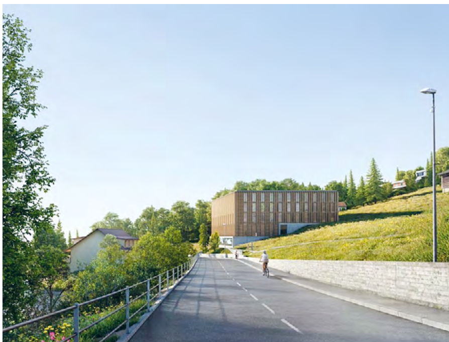
Vue de la façade Est du bâtiment d'hébergement et de formation. Une grande partie de la pente reste non construite.

L'Office fédéral du sport (OFSPPO) et l'Office fédéral des constructions et de la logistique (OFCL) ont présenté le projet remanié du bâtiment d'hébergement et de formation prévu à la population d'Évilard/Macolin. En même temps, les personnes présentes ont eu l'occasion de s'informer sur de nombreux autres sujets d'actualité du Centre national de sport de Macolin. La séance d'information avec l'exposition d'affiches a réuni quelque 60 personnes.